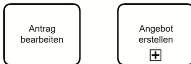
Abbildung 1: Darstellung von Aktivitäten

Am häufigsten werden Aktivitäten und Ereignisse in Prozessmodellen abgebildet. Aktivitäten sind die Elemente, in denen die eigentliche Aufgabe und Arbeit des Prozesses erledigt werden. Aktivitäten können atomar (Tasks) oder auch eine Zusammenfassung von untergeordneten Aktivitäten (Unterprozesse) sein. Beide werden als Rechteck mit abgerundeten Ecken dargestellt. Abbildung 1 zeigt den Task Antrag bearbeiten sowie den Unterprozess Angebot erstellen .